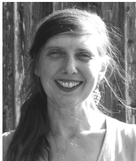
TANZFEUER Piry Krakow Romatänze